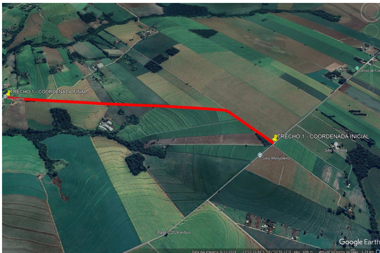
Figura 1- Vista aérea do trecho 1.